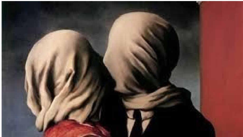
René Magrit, Los amantes

4. A partir de la siguiente imagen crea un texto inventado por ti. Respeta las normas ortográficas, la división de párrafos y recuerda los principios de coherencia, adecuación y cohesión. (Mínimo 15 líneas).