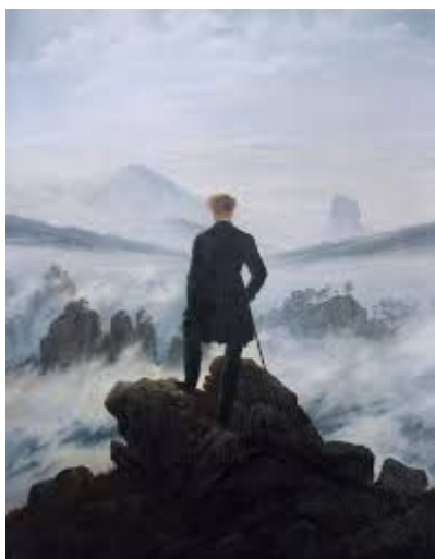
El caminante sobre el mar de nubes, Caspar David Friedrich

8. Copia tres oraciones de tu texto y analízalas sintácticamente.