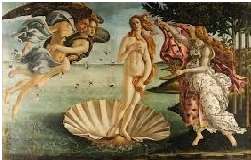
Botticelli, El nacimiento de Venus