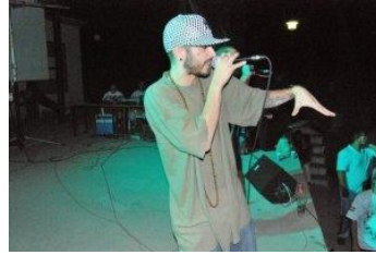
singen, ein Rap

4- Posa una creu en les persones que corresponen a cadascun dels verbs.